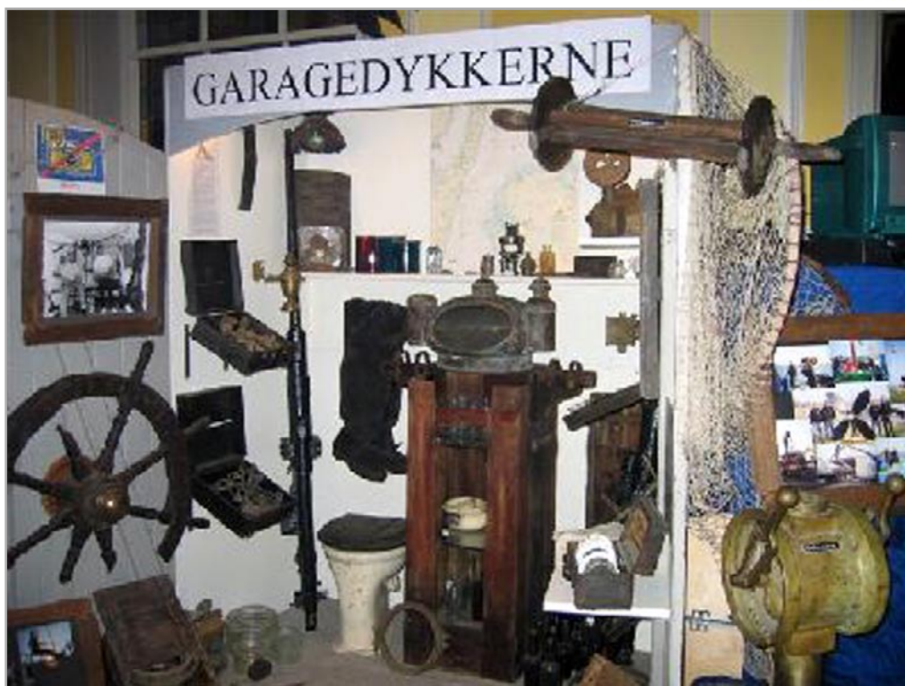
Billedet er fra sidste års vrugudstilling. Der er flere billeder på vores hjemmeside.