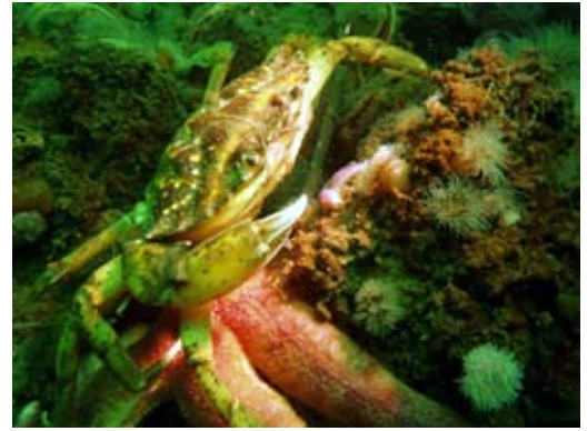
Billedbehandlet i Photoshop