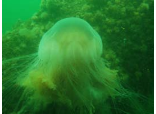
Det rå billede.