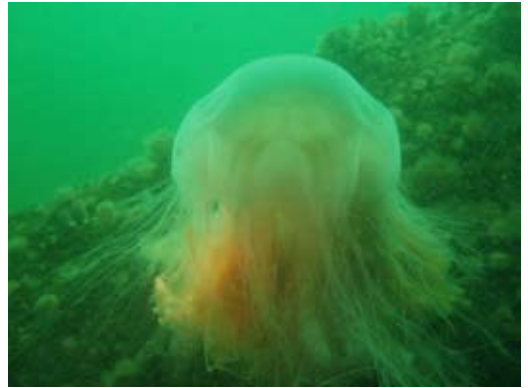
Det rå billede.