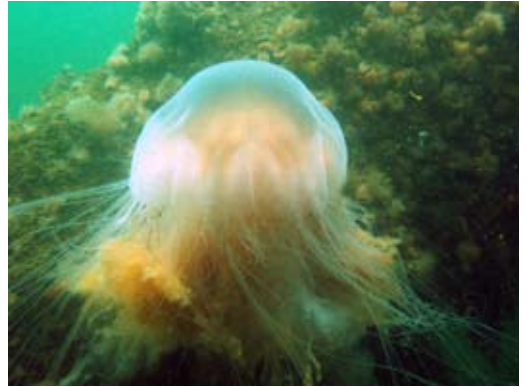
Billedbehandlet i Photoshop