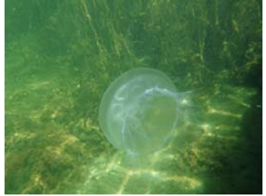
Det rå billede.