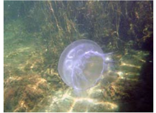
Billedbehandlet i Photoshop