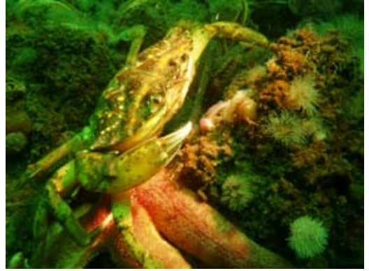
Det rå billede.