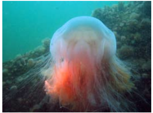
Billedbehandlet i Photoshop